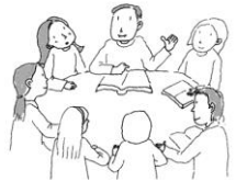
너는 배우고 묵신한 일에 거하라(딤후3:14)